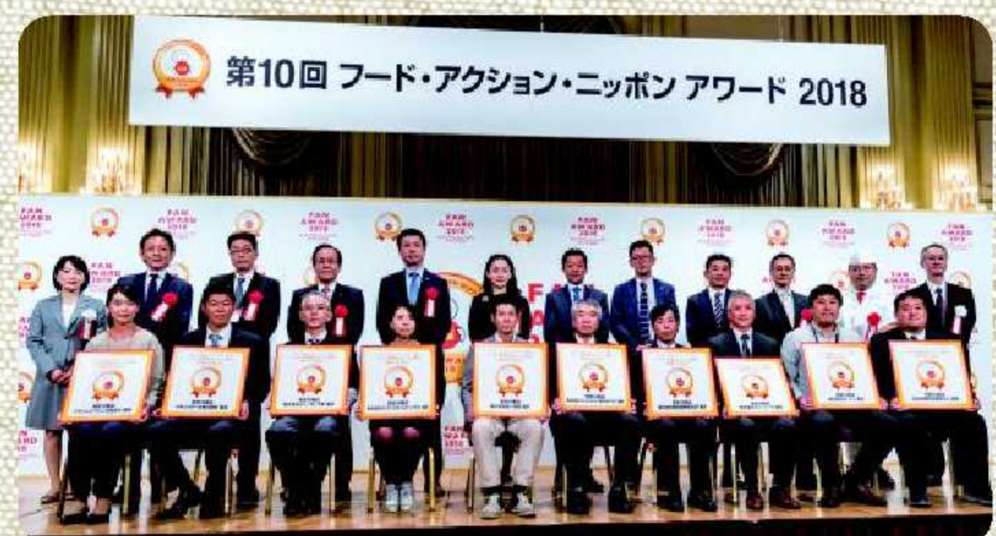
※昨年会場イメージ