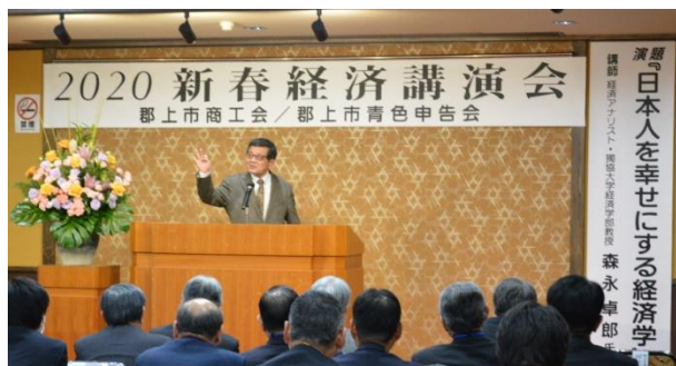
【森永卓郎氏による講演】

1月28日（火）ホテル郡上八幡において新春経済講演会 並びに異業種交流会が和田中濃県事務局長、青木副市長はじめ市議会、関係団体、金融機関など多くのご来賓と会員、200名超のご参加により開催されました。